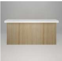
オーク キッチン腰造作 メラミン天板 突板 オイル塗装