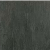
ビニルソイルタイル ダークグレー W450*H450*T3