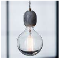
select ペンダントライト 大理石