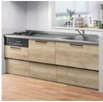
システムキッチン W2400 ガス加熱器 食洗機付