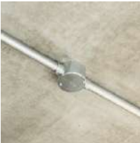
鉄管配管 電気配線用