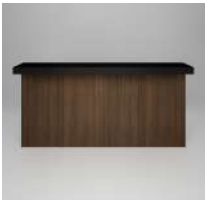
ウォールナット キッチン腰造作 メラミン天板 突板 オイル塗装