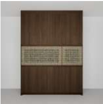
ウォールナット オイル塗装 W1800 H(天井まで)