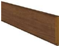
巾木 シート仕上 H30*L2750*T7