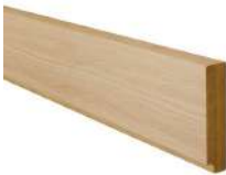
巾木 シート仕上 H30*L2750*T7