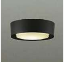
シーリングライト ブラック 60W電球色 Φ120