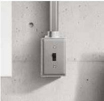
タンブラスイッチ 鉄管配管 露出ボックス ※躯体部のみ