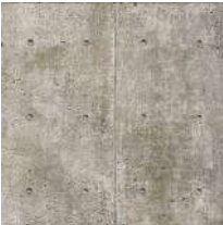
躯体現し ※解体後躯体状況による