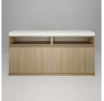
select バック収納付 扉4枚 内部棚4枚 突板 オイル塗装