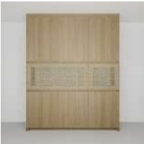
オーク オイル塗装 W1800 H(天井まで)